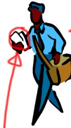
Le facteur = the mailman